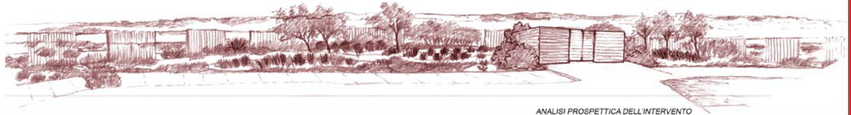
ANALISI PROSPETTICA DELL'INTERVENTO